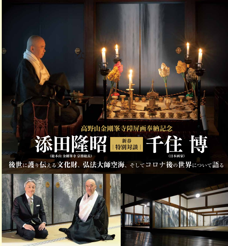
高野山金剛峯寺障屏画奉納記念